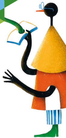
Illustration Bruno de Almeida Design chialab.it