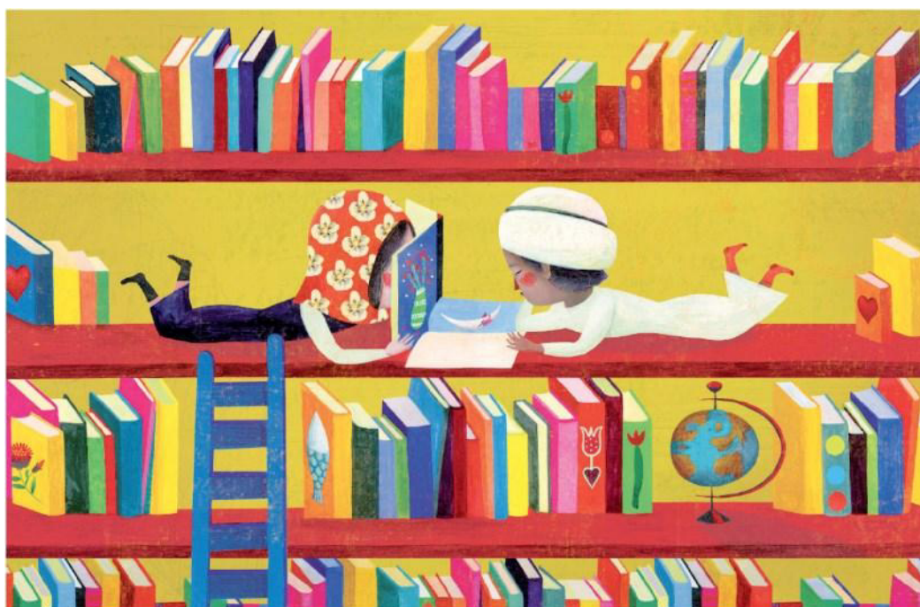
Un'illustrazione di Rebeca Luciani per il volume di Fatima Sharafeddine «Intorno a casa mia», edito da Gallucci-Kalimat