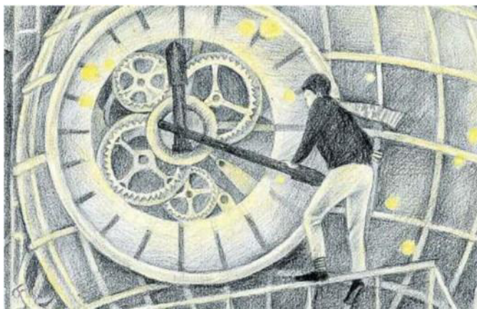
ILLUSTRAZIONI Sopra, una tavola del silent book "La Foglia" di Daishu Ma. A destra, un disegno di Fabian Negrin per "L'apprendista stregone"