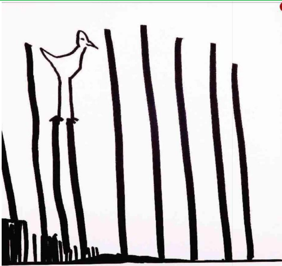
1 La Mostra degli Illustratori della Bologna Children's Book Fair è uno dei più importanti appuntamenti mondiali del settore. Le immagini di queste pagine sono tratte dal catalogo «Illustrators Annual» (Corraini Edizioni)